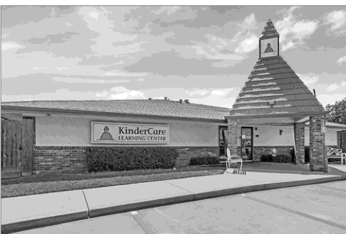
Foto referencial de activo en Texas mientras el operador finaliza su remodelación.

*Considera remuneraciones en Chile y vehículo extranjero